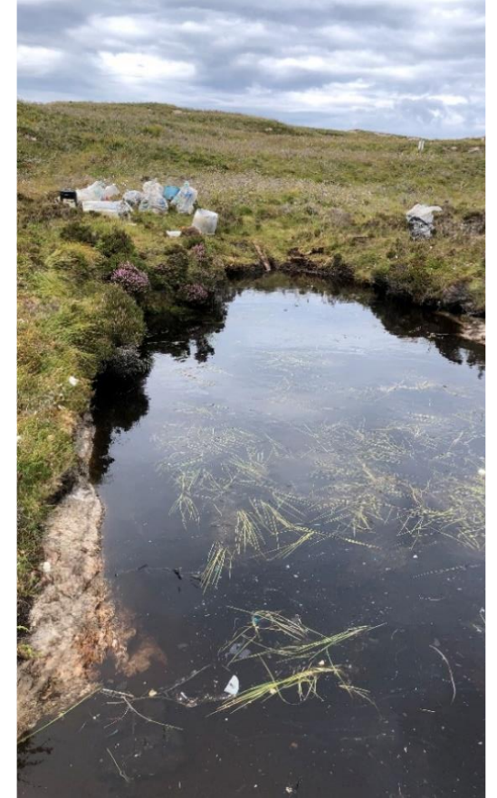
Vanndam på Lisle Lyngøy før (venstre) og etter rydding